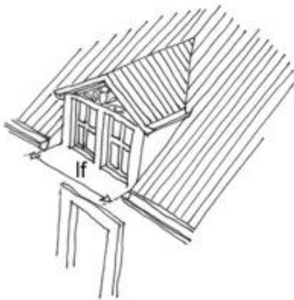
lucarne de façade : lf \leq 2,00m

Les autres lucarnes autorisées ne peuvent excéder 1,00m hors œuvre.