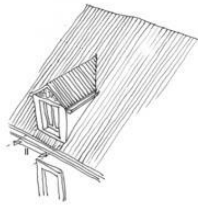
autres lucarnes : ll \leq 1,00m

La distance entre ces lucarnes et le mur pignon doit être d'au moins 1m. Elles ne peuvent pas dépasser le plan de la façade ni interrompre la corniche.